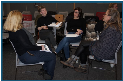
Sálfræðingar í vinnuhóp. Umræðurnar voru oft mjög líflegar og skemmtilegar.

Mikil ánægja var með vinnustofurnar og stendur til að svona „fræðavika sálfræðinga“ verði einu sinni á ári hjá ÞÍH.