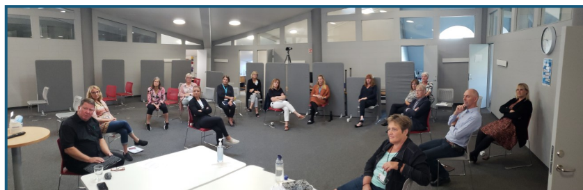
Starfsmannafundur ÞÍH í Covid

Á fundunum gefst gott tækifæri til að kynna starfsemi heilsugæslunnar og vaxandi að komu hennar að flóknum málum í mæðravernd. Síðar á árinu bíður það verkefni að tengjast öðrum heilbrigðisumdæmum á landinu.